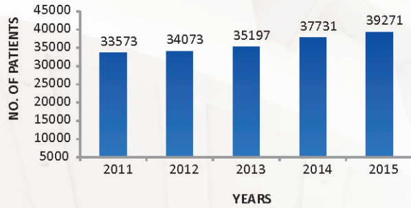
CASE FILE REGISTRATIONS